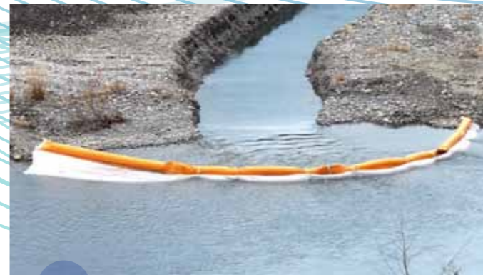
TYPE AS-30 垂下式シルトフェンス 河川内の工事に使用されています。